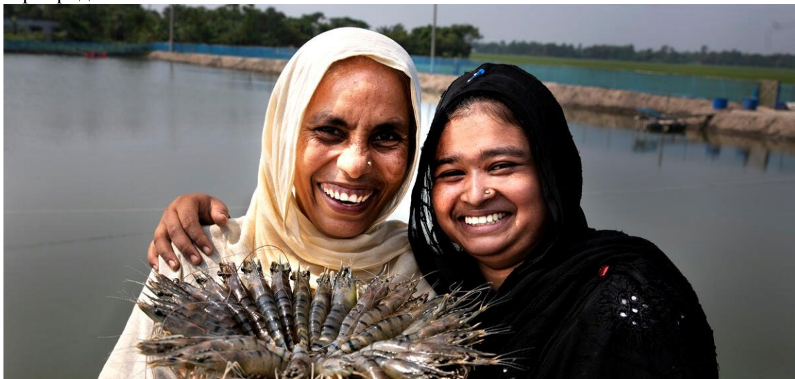
Женщины-рыбоводы из Бангладеш.