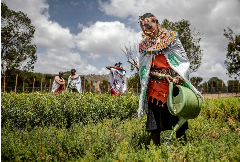
Представительница народа масаи поливает

по устранению гендерного разрыва и укреплению источников средств к существованию женщин во всем мире.