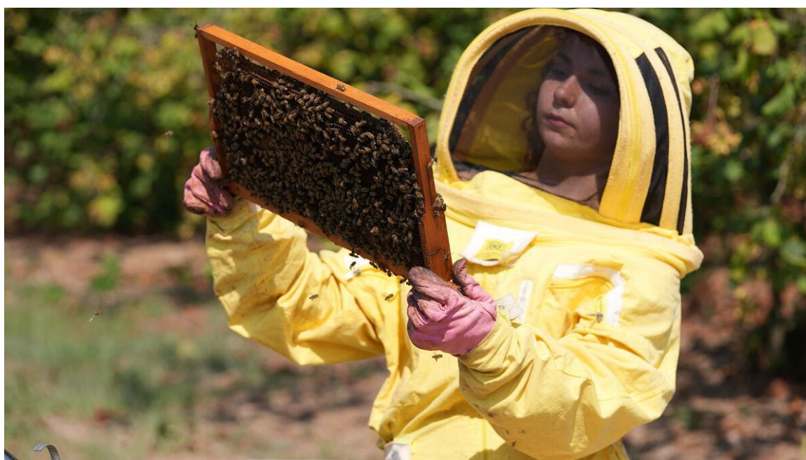
Женщина-пчеловод из Турции осматривает рамку с сотами, покрытую пчелами.

Изменение климата ведет к ухудшению положения женщин в сельских районах. Из-за экстремальной жары, засух и нерегулярного выпадения осадков нагрузка женщин растет, а производительность их труда снижается. Например, по последним данным, каждый день экстремально высокой температуры приводит к 3-процентному снижению общей стоимости урожая, выращенного фермерами-женщинами, относительно стоимости урожая, выращенного мужчинами. Препятствия в получении доступа к земельным ресурсам, финансированию, технологиям и климатической информации еще больше ограничивают возможности женщин для адаптации.